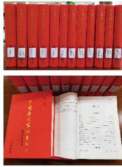
▲ 馆藏《中国历代家训集成》

的心灵中，融入中国人的血脉中，是支撑中华民族生生不息、薪火相传的重要精神力量，是家庭文明建设的宝贵精神财富。”我们要重视家庭建设，注重家庭、注重家教、注重家风。家风的形成，有赖于家训。家训教化助推了优秀家风的营造和传承，优秀家风的培育离不开家训文化的滋养。《中国历代家训集成》当中蕴含了丰富的智慧，便于读者更好地挖掘传统家训文化的精神内涵，为形成新时代的良好家风提供了学习借鉴。